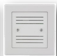
Signalgeber innen (optional)