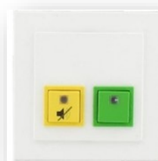
Dienstzimmermodul (A) (optional)